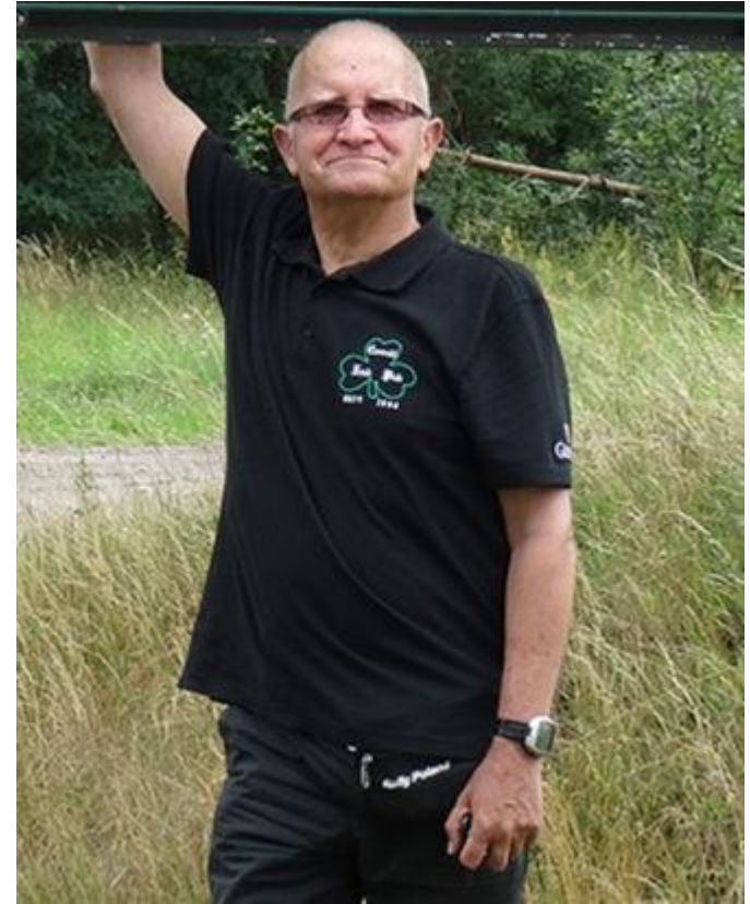
Automobil Klub Polski

Podczas przetargów starał się być na otwarciu ofert. Elegancko otwierał je przy użyciu swojego „szczerbca” i bardzo starannie oznaczał. Po posiedzeniu Komisji interesował się wynikami postępowań. Bardzo dbał o czytelne i poprawne dokumenty. Nie lubił braku staranności. Miał niesamowitą zdolność zauważania wszystkich literówek. Liczne puchary i dyplomy z rajdów Automobil Klubu Polski, które z dumą prezentował w Swoim gabinecie świadczyły o Jego dążeniu do celu.